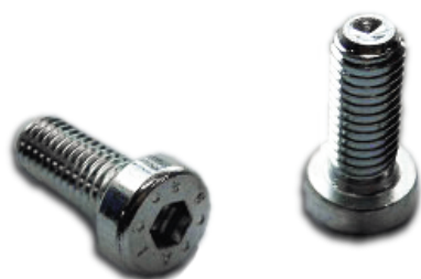
SCHROEF BZ. M8*20 MM DIN7984, LAGE KOP