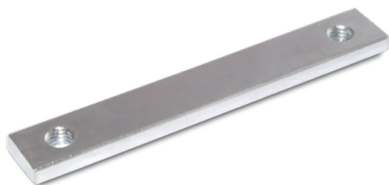
TEGENPLAAT H.O.H. 95 MM - M8