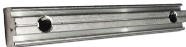
SCHUIFBLOK TAPGATEN H.O.H. 95 MM